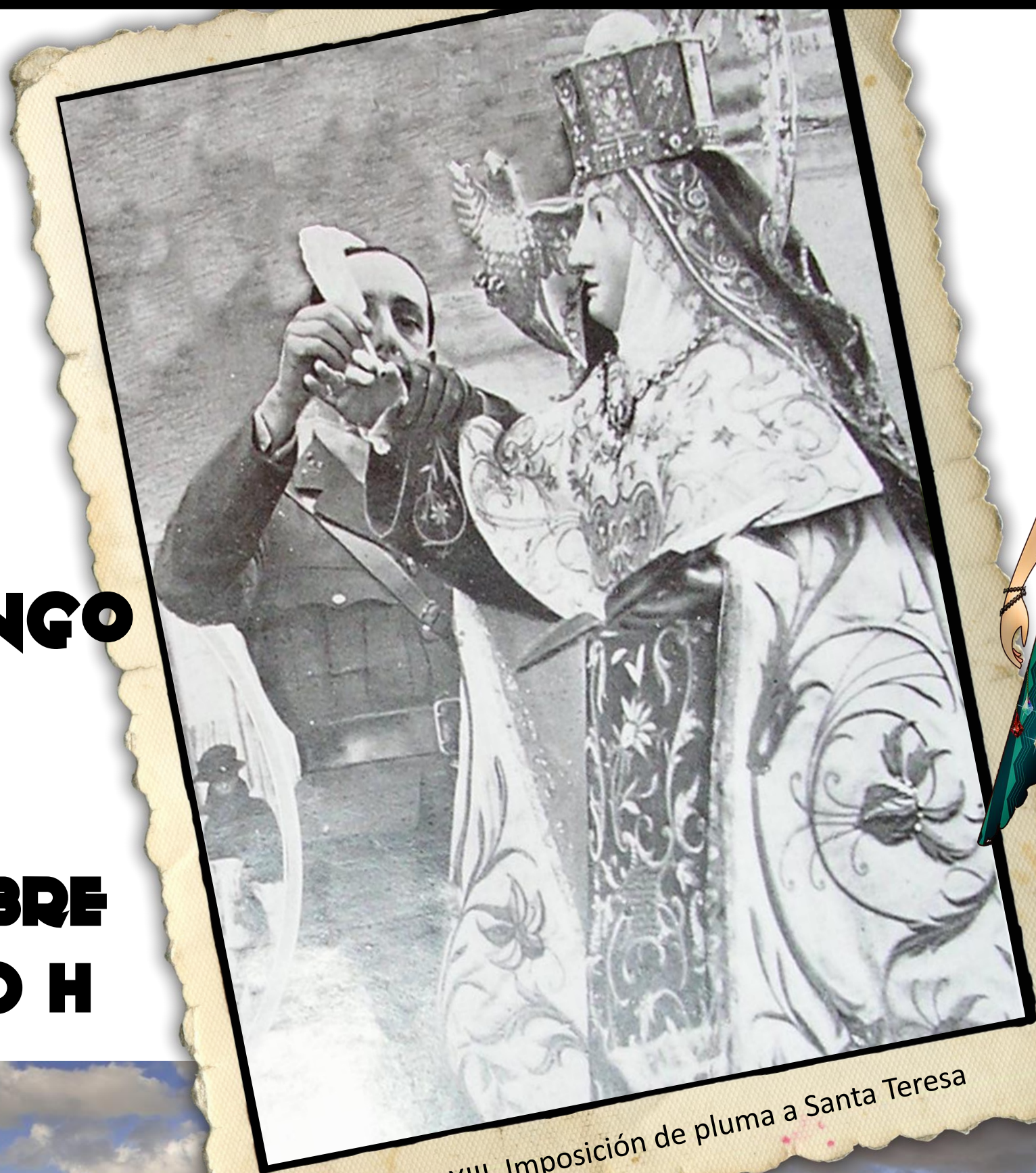
Alfonso XIII. Imposición de pluma a Santa Teresa